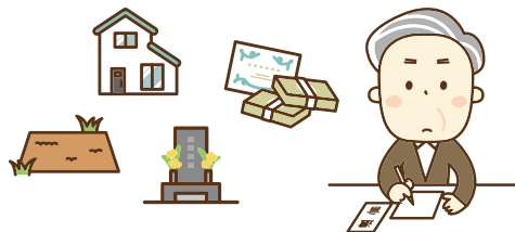
遺言書の作成支援をはじめとする遺産承継業務

遺言書を作る人に書き方のアドバイスを行います。また、亡くなった人の預貯金・株式など財産の引き継ぎも行います。