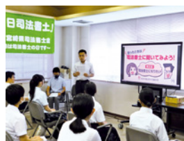
高校生のための「一日司法書士」