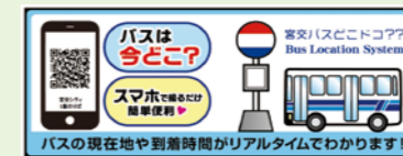
バスロケーションシステム

学校やイベントで、バスの乗り方や時刻表の見方、運賃の見方などを教えるバス教室を行っています。