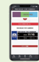
デジタルチケット