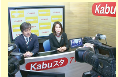
最新の経済情報を発信