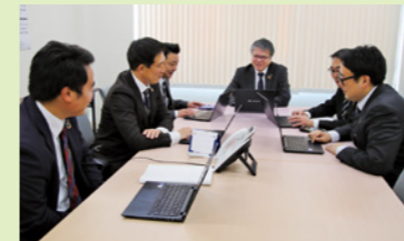
最新の情報を共有するミーティング