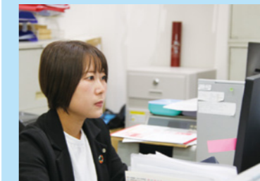
ルールが守られているかチェック