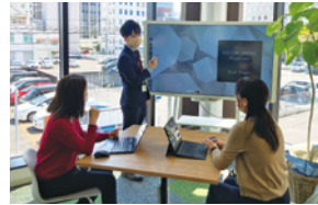
テレビ会議システム