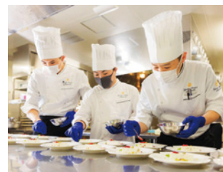
キッチンスタッフ

披露宴に参列されるすべてのお客様に、お食事やお飲み物をサービスします。細やかな気配りを大切にしています。