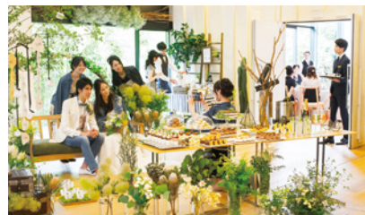
ウェディングルーム

挙式披露宴が始まるまでの時間もゲストに楽しんで過ごしてほしいという思いで作られたスペースです。