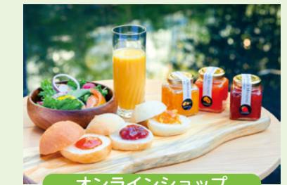
オンラインショップ

お葬式後の必要な手続きのアドバイスから、故人の魂を供養する「法事・法要」のお手伝いも行っています。