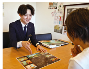
ウェディングスタッフ

新郎新婦の大切な結婚式をプランニングする仕事です。半年から一年近くかけてお客様の理想を形にするお手伝いをします。