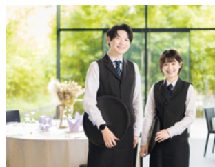
バンケットスタッフ

新郎新婦の大切な結婚式をプランニングする仕事です。半年から一年近くかけてお客様の理想を形にするお手伝いをします。