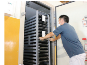
発芽室ですべて同じ大きさに発芽させます。

野菜の品種によって発芽のタイミングが違うので、経験と感覚を頼りに、発芽に最適な環境づくりや管理をしています。