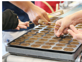
機械や人の手で種をまいていきます。

多いときには、1日に20万個以上の種をまくこともあるので、種を間違えないように注意しながら、手際よく作業をしています。