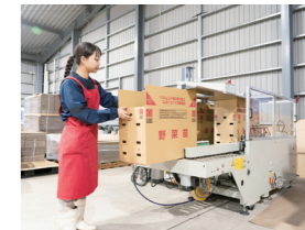
畑に植えるのに最適な大きさに育ったら出荷します。

野菜の品種や高さで発送する箱の大きさも違うので、注意が必要です。箱を開けたときに、いい苗に見えるような箱詰めをしています。