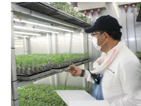
接木を養生室に入れて、成長しやすくします。

接木した苗を養生室に入れて活着させます。品種によって成長に最適な湿度や光の量があり、この調整に気を使いながら作業します。