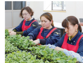
1本1本丁寧に手作業で接木します。

毎日たくさんの接木をするため、多いときは60人以上で作業します。接木は、切り方ひとつで完成形が変わるので、正確さと速さが大切です。