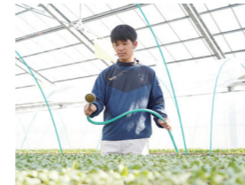
ハウスに移動して、接木に適した苗に育てます。

苗は水をかける量や、日光の当たり方で成長が違ってきます。すべて同じ大きさに育つように、これらに注意しながら作業します。