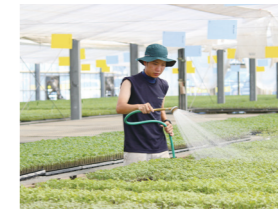
ハウスに移動して、均一で健康な苗に育てます。

くつついた苗を、病気や日焼けに気を付けながら成長させます。また、出荷前なので、見た目もきれいになるように調整しています。