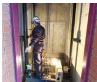
④レールに油を注入します