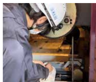
⑥ドアセンサーを掃除し、作動を確認します