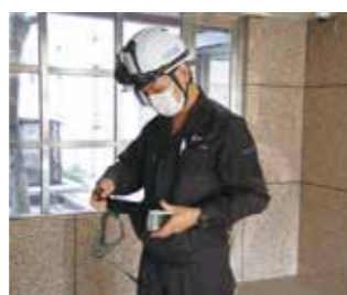
②ヘルメットと安全ベルトを着用します