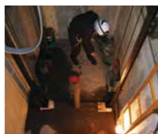
③エレベーターの底の部分の掃除をします