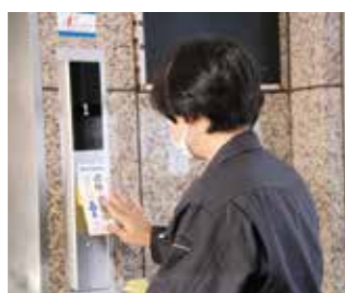
①エレベーターを停止します