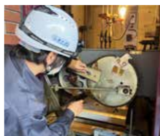
⑤ベルトがゆるんでいないか確認します